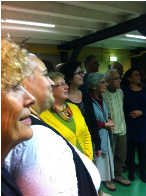
Enkele deelnemers aan de dag van de Dialoog.

Na de gesprekken vertrok men naar het Stadhuis van de gemeente Apeldoorn om daar deel te nemen aan de afsluiting van de Dag van de Dialoog.